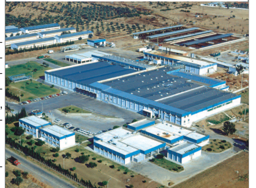
Türkiye'nin İlk Özel Entegre Et Tesisi

Ayrıca, 2005 yılında Türkiye Cumhuriyetleri'ne başlayan deniz ürünleri ihracatı 2006 yılında artarak devam edecektir.